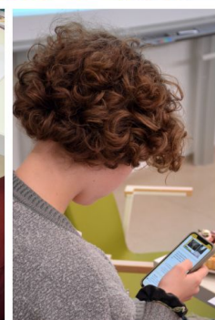
Foto: DISKUSE – ŠKOLENÍ – HANDS-ON POMOC tři pilíře našich kulatých stolů, kde se setkávají zástupci firem, institucí a rodičů.